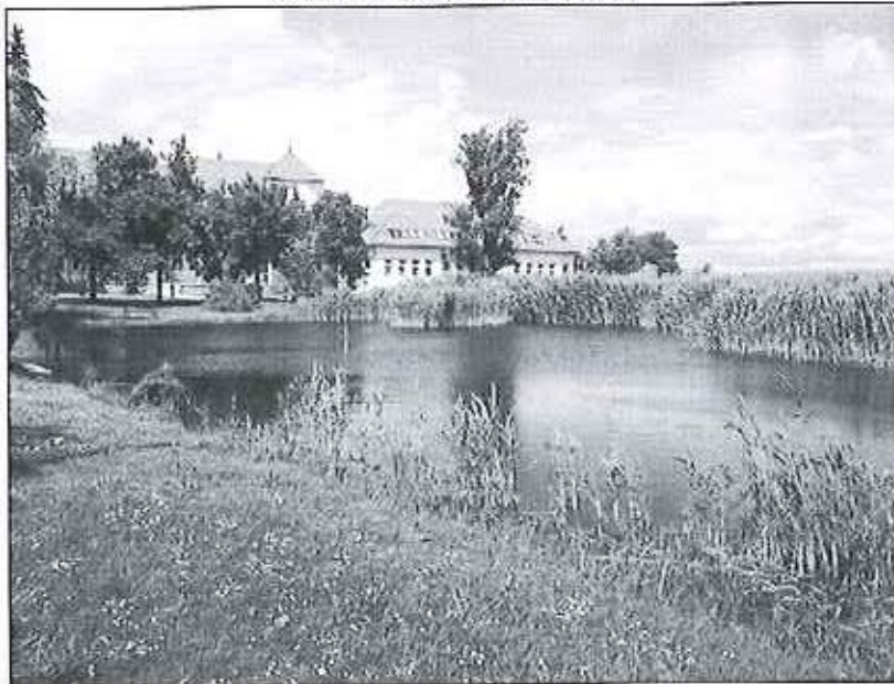
6. ábra Kakasszéki Júlia fürdő