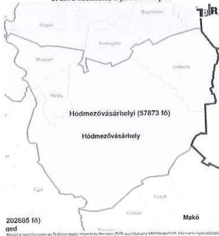
3. ábra Székkutas a járási térképen

Székkutas község Magyarország Dél-Alföld Régiójában, Csongrád megye középső részének keleti felén, Hódmezővásárhelyi Kistérségében fekszik. A járás a Körösök és a Maros folyó által lehatárolt Körös-Maros közti síkság területén helyezkedik el, Dél-Tisza völgyét és a Csongrádi-síkot érinti. A község területe 124 km 2 .