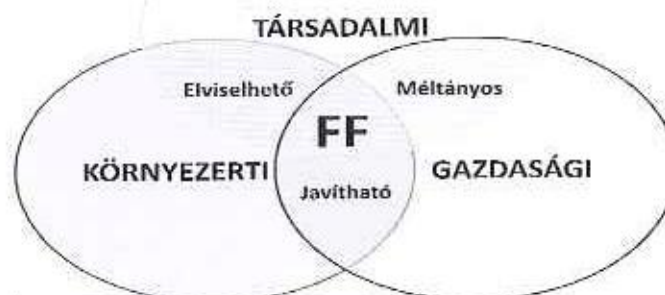
1. ábra: A Fenntartható Fejlődés alappillérei

A fenntartható fejlődés három alappilléren nyugszik: a szociális (társadalmi), a gazdasági és a környezeti pillérek és mindháromat együttesen, kölcsönhatásaik figyelembevételével mérlegelni kell a különböző fejlesztési stratégiák, programok kidolgozása során, illetve a konkrét intézkedésekben, cselekvésekben. A fenntartható fejlődés, mint általános stratégiai cél "bevonult" a nemzetközi konferenciák, szervezetek dokumentumaiba és a nemzeti kormányok cselekvési programjaiba.