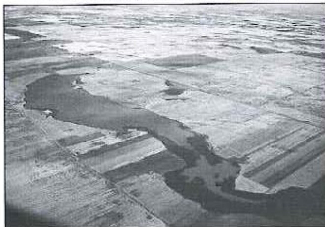
5.ábra A kardoskúti Fehér-tó madártávlatból

Magas Természeti Értékű terület (MTÉT) 61/2009. (V.14.) FVM rendelet 6. számú melléklete szerint a Békés-Csanádi hát.