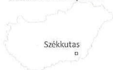
2. ábra: Székkutas elhelyezkedése

Székkutas község Magyarország Dél-Alföld Régiójában, Csongrád megye középső részének keleti felén, Hódmezővásárhelyi Kistérségében fekszik. A járás a Körösök és a Maros folyó által lehatárolt Körös-Maros közti síkság területén helyezkedik el, Dél-Tisza völgyét és a Csongrádi-síkot érinti. A község területe 124 km 2 .