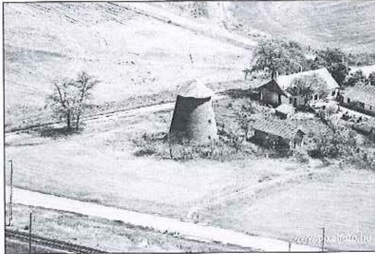
5. ábra Piroska szélmalom

A kakasszéki Júlia-fürdő a 30-as évektől fogadta a gyógyulni vágyókat. A korabeli hangulatot árasztó gyógyintézet ma a vásárhelyi Erzsébet Kórház kihelyezett reumatológiai és rehabilitációs osztályának ad helyet.