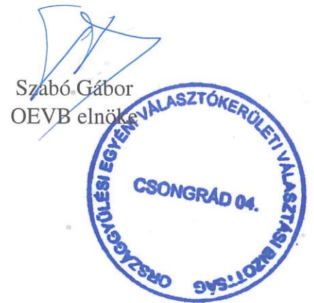
Szabó Gábor OEVB elnöke